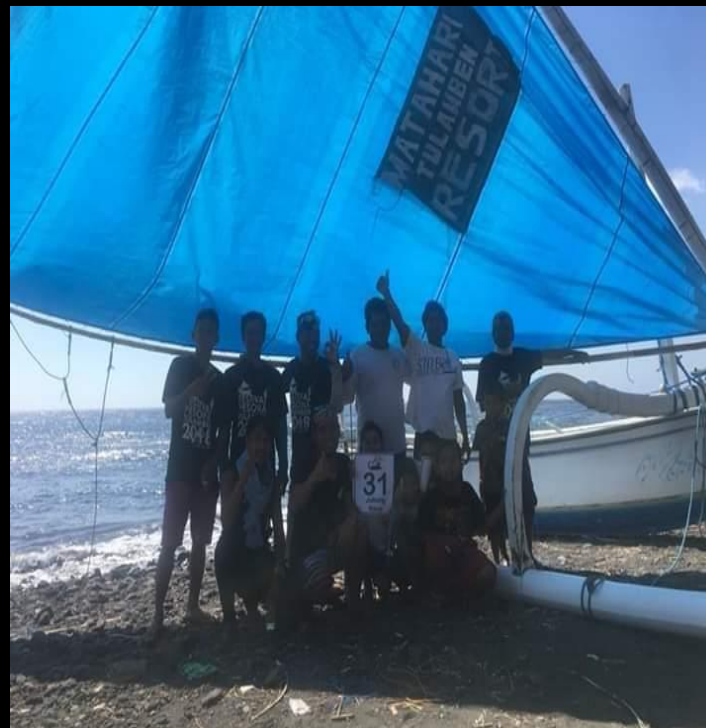
SALAH SATU PESERTA PARADE JUKUNG