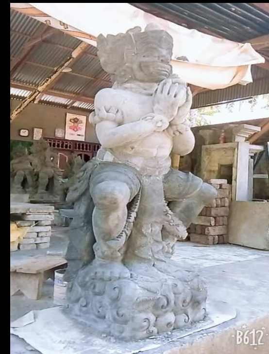
STRUKTUR PATUNG BIMA