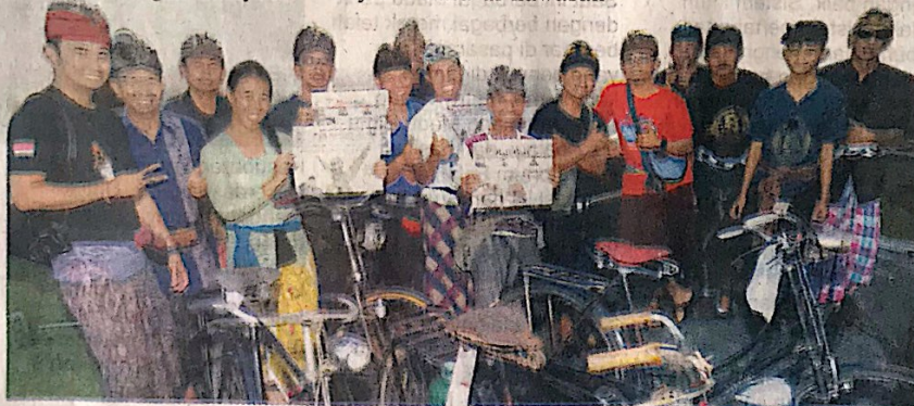
BOC - Puluhan penggemar sepeda ontel yang tergabung dalam Buleleng Ontel Club (BOC) berpartisipasi dalam pembagian koran KMB edisi khusus Minggu (29/9) kemarin.