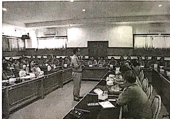
Kegiatan sosialisasi kearsipan di lingkup Setda Kabupaten Buleleng, Bagian Organisasi Setda Buleleng bekerja sama dengan Dinas Arsip dan Perpustakaan Buleleng.

Putu Karuna menambahkan tujuan kegiatan untuk mewujudkan tertib administrasi dan tertib arsip dalam rangka memaksimalkan pelayanan publik. "Melalui Sosialisasi ini kita harap setiap bagian yang ada di Setda Buleleng mampu menata dan mengelola kearsipan secara profesional, sehingga mampu meningkatkan akuntabilitas pelayanan di bidang kearsipan," ucapnya. ■ira