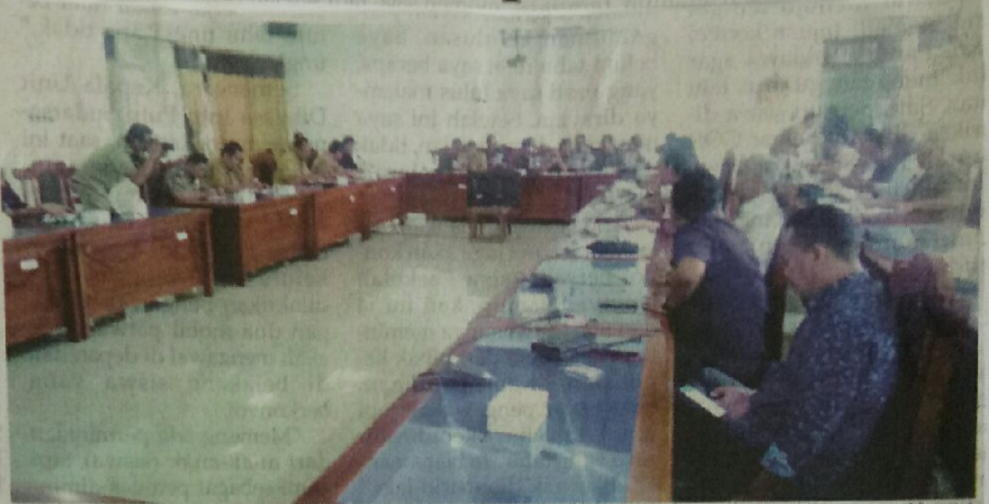
RAPAT PARIPURNA: Fraksi di DPRD Buleleng pending pembahasan Ranperda PT BPR Bank Buleleng.

Gabungan Fraksi PDI Perjuangan, Gerindra, dan Hanura melalui jubirnya, Ni