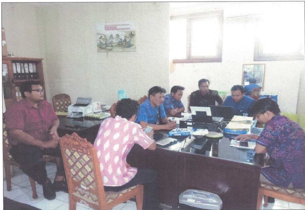
Pelaksanaan aanwijzing oleh Pokja 3 untuk paket Konsolidasi Belanja Alat Tulis Kantor dengan dihadiri PPK Disdikpora pada tanggal 5 Maret 2019