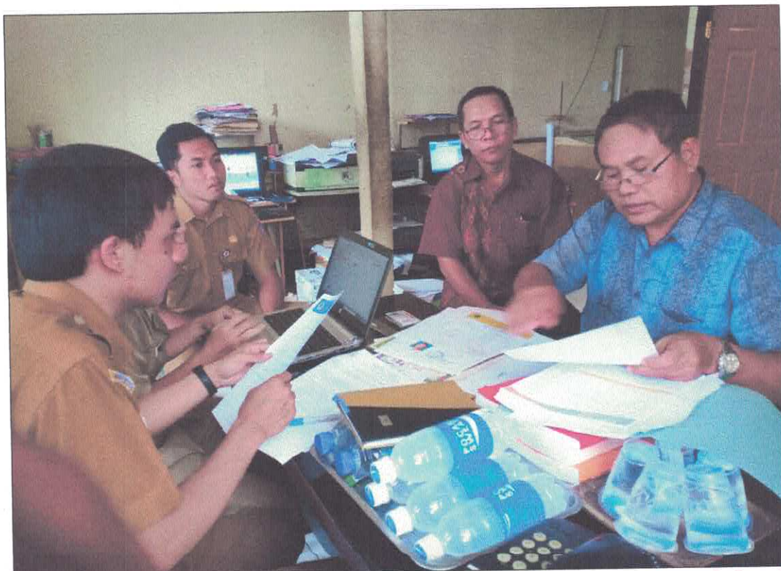
Anggota Pokja 4 melakukan kegiatan klarifikasi dan verifikasi lapangan terkait paket Konsolidasi Belanja Cetak Buku pada tanggal 4 Maret 2019