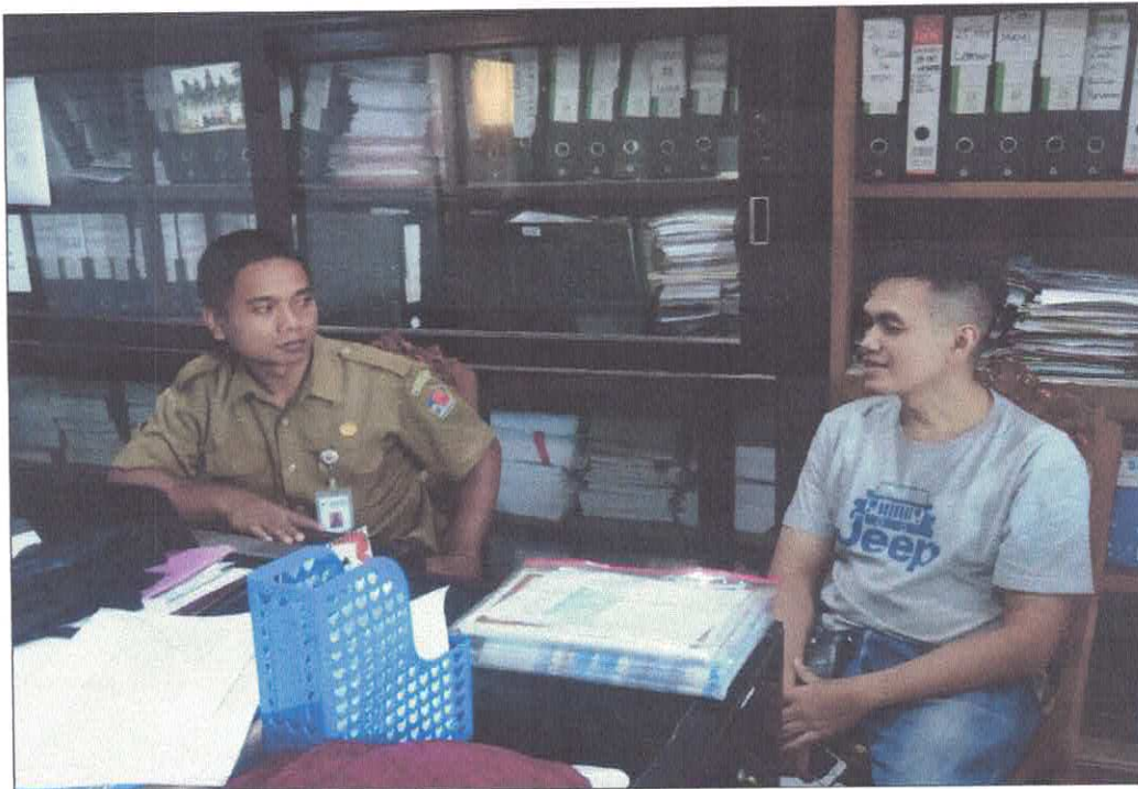
Pokja BLP melakukan kegiatan pembuktian kualifikasi paket Biaya Alat Tulis Kantor dari RSUD serta Konsolidasi Belanja Fotocopy dari BKD diruang kerja pokja pada tanggal 4 Maret 2019