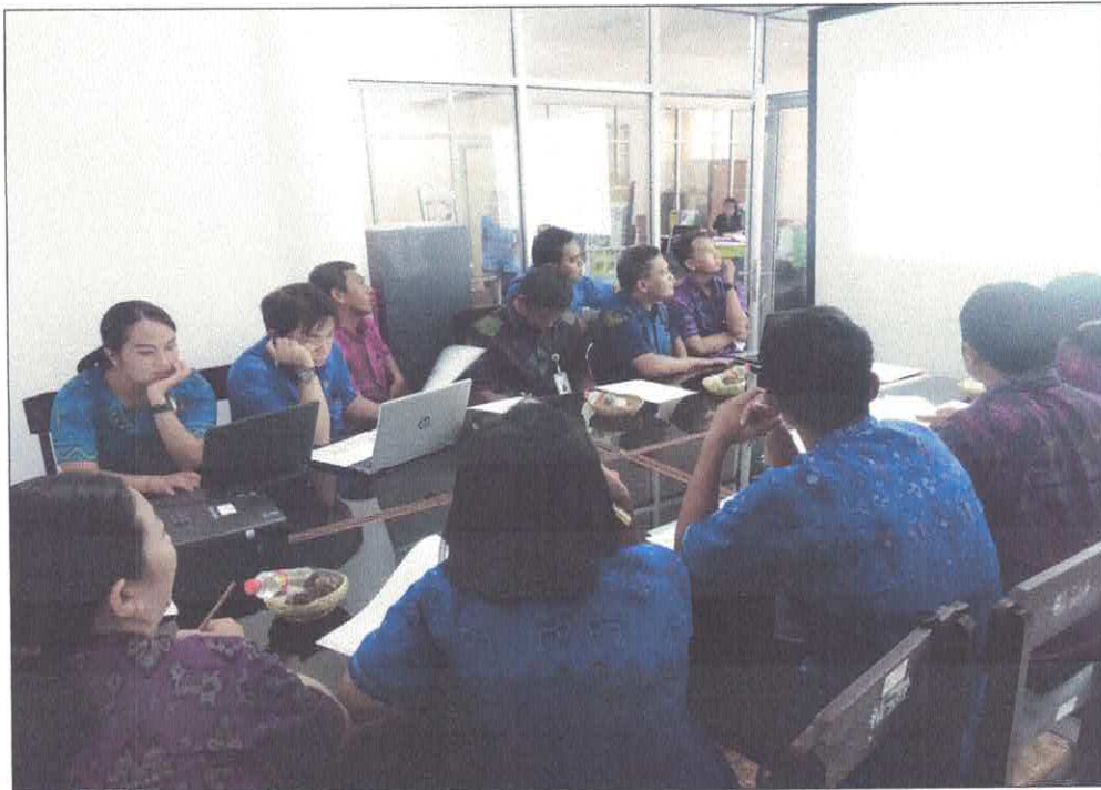
Kegiatan reviu paket Belanja Alat Tullis Kantor, Biaya Bahan Pembersih dan Alat Kebersihan, Pembangunan Drainase dan Trotoar Desa Kalibukbuk, Biaya Bahan dan Alat Dapur/Pentry serta Biaya Linen pada tanggal 26 Maret 2019