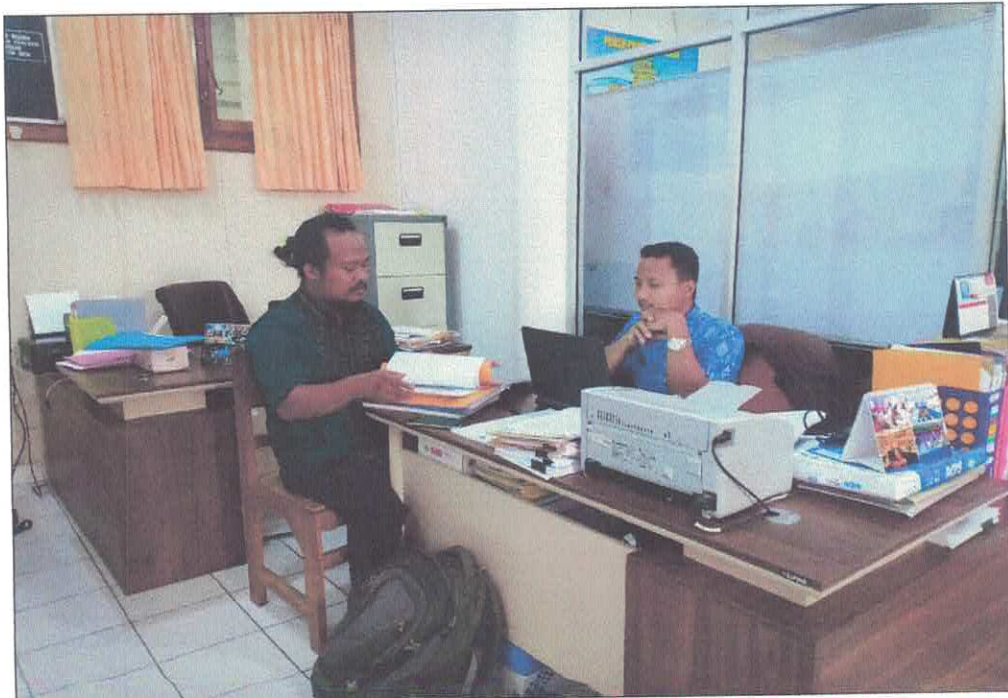
Pokja 4 melakukan kegiatan pembuktian kualifikasi terkait paket Biaya Bahan Makanan/Logistik Pasien Basah pada tanggal 26 Maret 2019