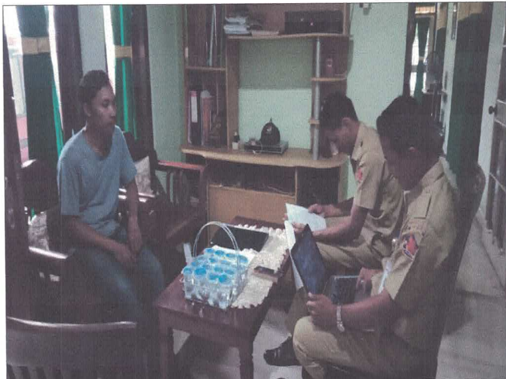
Pokja 4 melakukan kegiatan klarifikasi dan verifikasi lapangan paket Biaya Bahan Makanan/Logistik Pasien Basah pada tanggal 25 Maret 2019