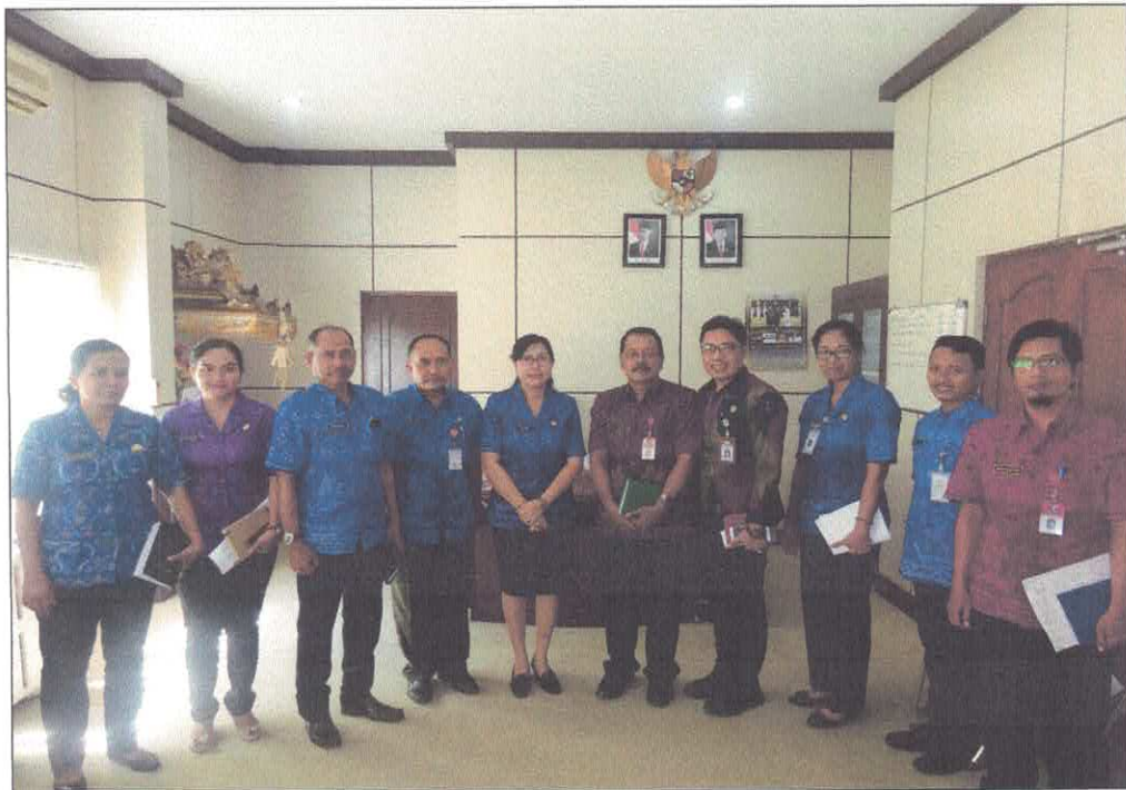
BLP Buleleng menggelar rapat pembahasan SDM Pokja dan LPSE yang dipimpin Asisten Administrasi Perekonomian & Pembangunan Setda serta dihadiri BKPSDM, Inspektorat, Kominfosandi dan Bagian Organisasi pada tanggal 5 Maret 2019