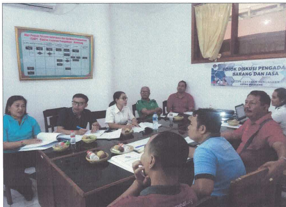
Kegiatan reviu paket Peningkatan/Optimalisasi SPAM Perdesaan Desa Lemukih, Pengadaan Mesin Tempel 15 PK, Belanja Blanko serta Penyusunan Kajian Teknis, Evaluasi dan Penilaian Pelaksanaan Revisi Tata Ruang Wilayah Kabupaten Buleleng Tahun 2013-2033 pada tanggal 15 Maret 2019