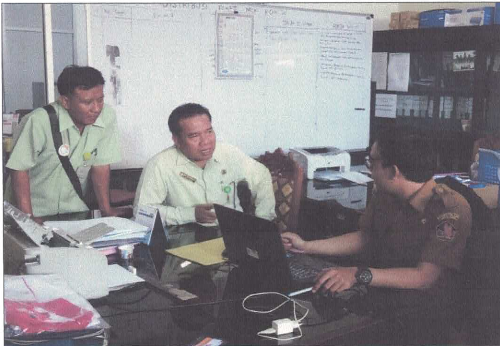
Pokja BLP melaksanakan kegiatan aanwijzing paket Konsolidasi Belanja Cetak Blangko dan Karcis dihadiri PPK BKD serta Biaya Bahan Makanan/Logistik Pasien Kering dihadiri PPK RSUD pada tanggal 11 Maret 2019