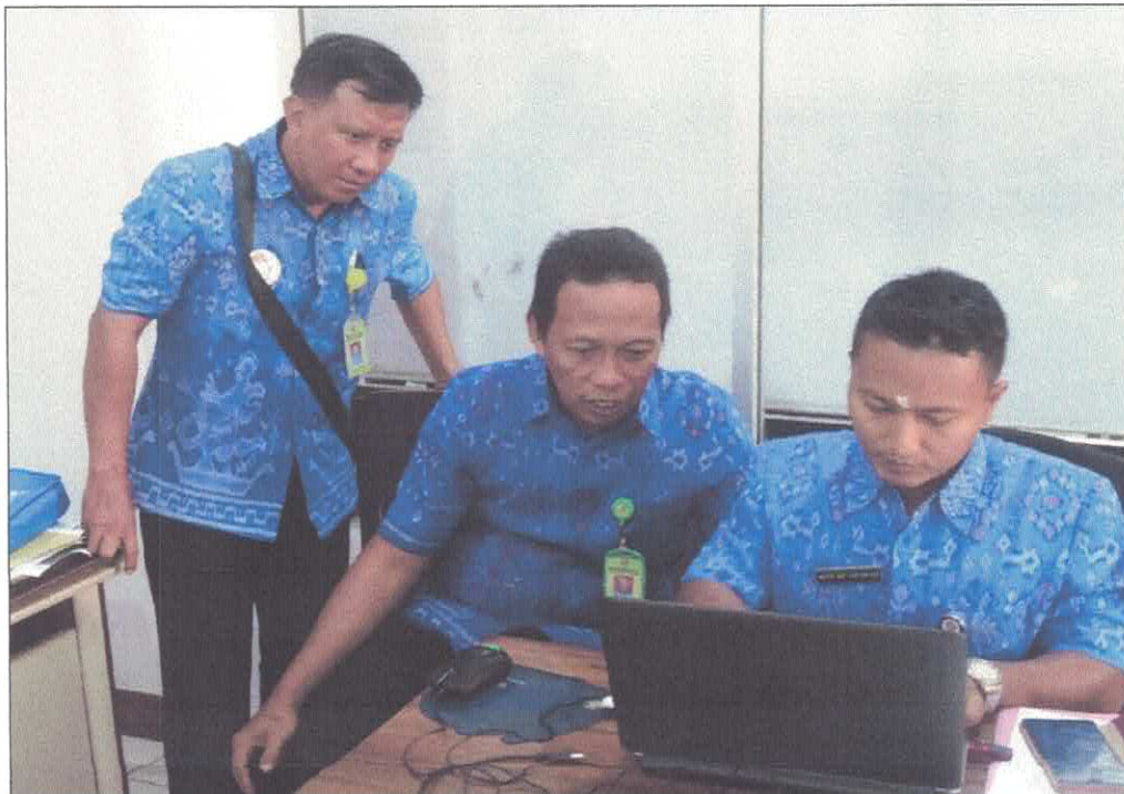
Pokja 4 melakukan kegiatan aanwijzing terkait paket Biaya Bahan Makanan/Logistik Pasien Basah dari RSUD Buleleng pada tanggal 12 Maret 2019